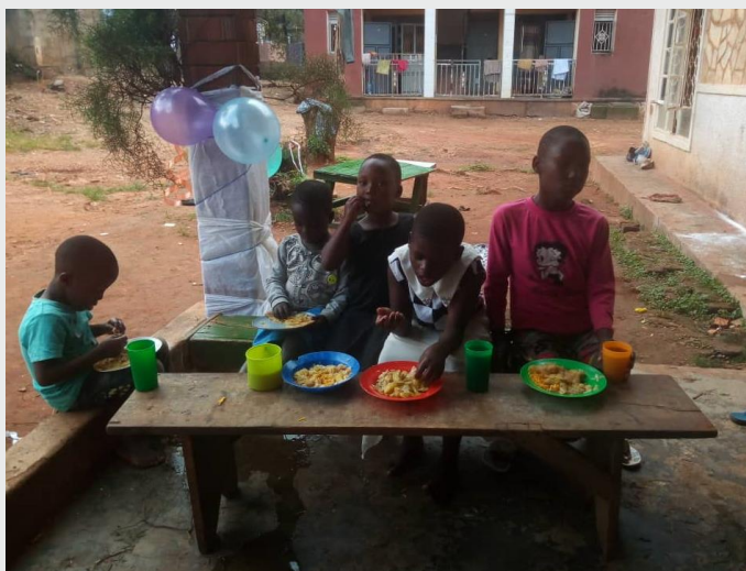
Zo zag het kerstdiner eruit ^